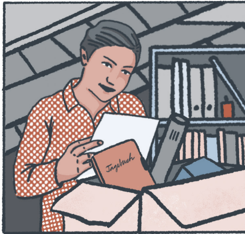
„Das sieht ja spannend aus. Sie war Lehrerin und Vor- ständig im Turnverein – Sie hat sogar Tagebuch geführt!“