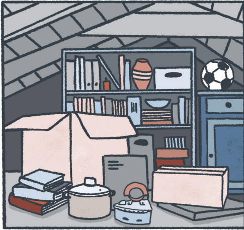
„Ach die alten Sachen von Tante Gerti.“