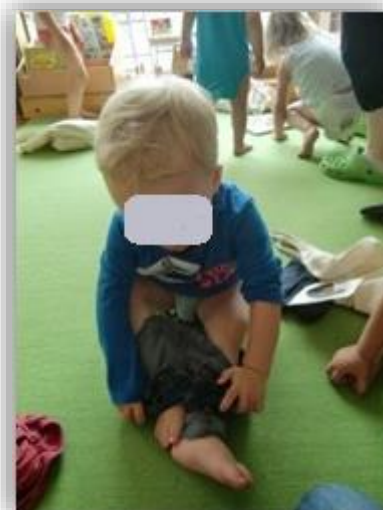
J. beim Ausziehen vor dem Schlafengehen

Fachkräften bewusst genutzt, um die Beziehung zwischen Kind und Fachkraft zu stärken und das Kind in seinen aktuellen Entwicklungsthemen, wie z.B. der Autonomieentwicklung, zu unterstützen. Schlüsselsituationen sind deshalb so entscheidend, weil ein Kleinkind in diesen Situationen sehr deutliche Rückmeldungen zu seiner Person, zu seinem Körper und seinen Bedürfnissen bekommt. Das Kind nimmt sehr genau wahr, wie mit ihm umgegangen wird und wie die Erwachsenen auf seine Bedürfnisse, Grenzen und Empfindungen reagieren. Die pädagogischen Fachkräfte nehmen in diesen Situationen stets eine Vorbildfunktion ein, an welchem sich die Kinder automatisch orientieren. Zur bewussten Gestaltung pädagogischer Schlüsselsituationen gehören mehrere Aspekte. So ist es zum Beispiel wichtig die Kinder miteinzubeziehen und partizipieren zu lassen. Nur so lernen sie, dass ihre Handlungen und ihre Aussagen wirksam sind. Zudem sollen Schlüsselsituationen sprachlich begleitet sein, um sie für die Kinder vorhersehbar zu machen und den Kindern Raum für Kommunikation zu bieten.