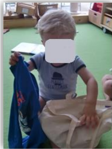
J. legt den Pullover in seinen Stoffbeutel; Quelle: Stadt Stuttgart

jetzt zusammen den Pullover ausziehen. Nach dem Ausziehen legt J. seinen Pullover in den Stoffbeutel und sieht fröhlich zur pädagogischen Fachkraft. Er ruft „Schafft!“ und legt seinen Beutel an die Seite. Pflege-, Essens- und Schlafzeiten sind bedeutsame pädagogische Schlüsselsituationen, die einen hohen Stellenwert im Kleinkindbereich einnehmen. Diese Situationen werden von pädagogischen