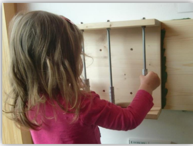
L. beschäftigt sich mit der Klangwand; Quelle: Stadt Stuttgart

Eine professionelle Beziehungsgestaltung, d.h. ein verlässliches, einfühlsames und vertrauensvolles Interagieren, ist Aufgabe der pädagogischen Fachkräfte und dient den Kindern als Vorlage für alle weiteren Beziehungen.