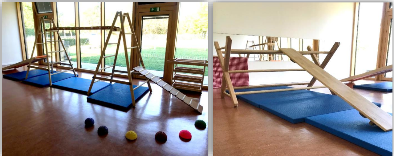
Bewegungsraum mit Hengstenberg Elementen; Quelle: Stadt Stuttgart

Im Pendant zu den oben genannten Pikler Elementen im Krippenbereich, stehen den Kindern von 3 bis 6 Jahren die Hengstenberg - Elemente zur Verfügung.