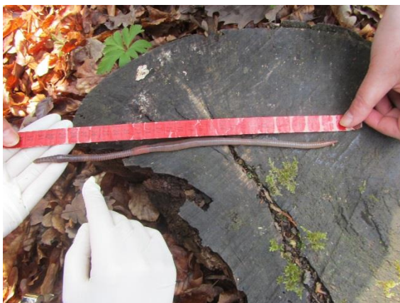
Die Kinder haben im Wald einen Regenwurm gefunden und fragen: "Wie lang ist ein Regenwurm?"

Dadurch entsteht eine Beziehung zur Natur, den Tieren, Blumen und Bäumen, die den Kindern ermöglicht zu lernen, dass unsere Umwelt schützenswert ist.