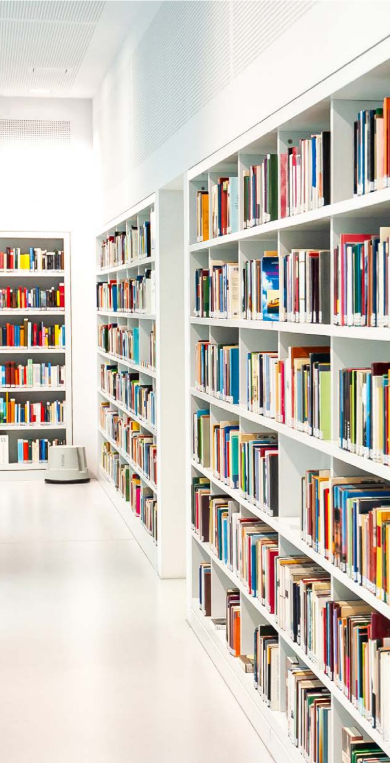
Kapi - stock.adobe.com ©