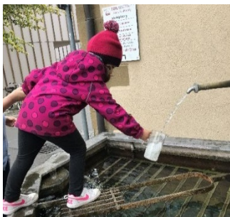
Abb. 15 Wir holen Mineralwasser am Polizeibrunnen, Jugendamt/Stadt Stuttgart

Die zentrale Lage unserer Kita hat den Vorteil, die vielfachen Sehenswürdigkeiten (Wilhelma, Naturkundemuseum, Stadtmuseum etc.), Grünflächen (Kur- und Rosensteinpark) und Spielplätze in kürzester Zeit mit unseren Kindergruppen zu erreichen. Bad Cannstatt ist außerdem bekannt für sein Mineralwasser, das in vielen Brunnen