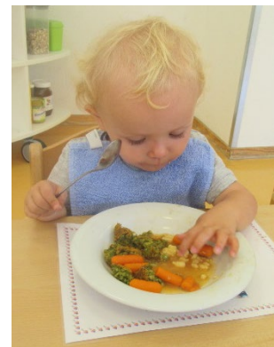
Abb. 13 Kleinkind beim Mittagessen

Wir sehen das Essen im Alltag als ein ganzheitliches Erlebnis. Die Kinder erfahren das Essen mit allen Sinnen. Die Selbstwirksamkeit und die Entscheidungsfreiheit der Kinder stehen im Zentrum der pädagogischen Arbeit. Die Kinder entscheiden, was sie essen und probieren möchten! Pro Tisch ist eine Fachkraft anwesend, die die Kinder unterstützt und begleitet. Jeder Tisch wird ansprechend vorbereitet, so dass die Kinder alle Essensutensilien selbst auswählen können. Wir handeln als Vorbild und essen mit den Kindern gemeinsam.