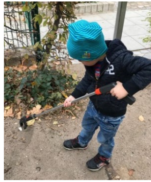
Abb. 9 "Kann ich bitte die Müllhände haben?"

Unser Außengelände, bestehend aus zwei Gärten mit Spiellandschaften und einem Fußballplatz, soll alle Sinne anregen. Der Garten bietet Formenvielfalt, Höhenunterschiede (Steine, Kletterlandschaften) und unterschiedliche Bodenstrukturen wie Beton, Sand, Matsch, Erde an. Wir sehen unseren Außenbereich als natürliches Gelände, das die kindliche Bewegungslust auf vielfältige Weise herausfordert. Je nach Anforderung werden die Kinder durch die Außengestaltung zum Springen, Rennen, Klettern oder Rutschen aufgefordert. Des Weiteren bietet unser Außenbereich eine Wundertüte an Spielideen an. Alles, was sich im Gelände befindet, kann für Spiele genutzt werden. So bieten z.B. Steine, Sträucher und Hecken und die Geräteschuppen die perfekten Rückzugsmöglichkeiten. Kleine Öffnungen in der Gartenhecke werden als Fenster oder als Eisverkaufsstelle genutzt. Der Betonweg wird zur Rennstrecke für Fahrzeuge aller Art. Im Sommer wird das Wasser im Sandkasten aufgestaut und die Kinder lassen ihre "Rindenmulch-Boote" schwimmen. In unseren For-