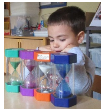
Abb. 7 Wie schnell vergeht die Zeit?, Jugendamt/Stadt Stuttgart

Wir alle sind im Alltag stets von Zahlen und Formen umgeben. Mathematik ist in der gesamten Einrichtung auffindbar - im Mathematikbereich, in der Küche, im Bistro, beim Spielen in den anderen Bildungsbereichen. Durch das Erlernen mathematischer Kompetenzen können Kinder Ordnung in ihre Welt bringen, sie wird berechenbarer und vorhersehbarer. Sie fördern bei Kindern die Entwicklung abstrakten Denkens. Die Beschäftigung mit Zahlen und Größen, mit ordnen und messen eröffnet Kindern die Welt mathematischer Zusammenhänge. Im Altersbereich 0 bis 3 Jahre liegt der Schwerpunkt in folgenden Bereichen: Erstens das Erfassen von Ordnungen. Hierzu gehören Muster, Ornamente und Strukturen, die den Kindern überall begegnen. Dies können z.B. Wasserspuren im Sand oder die Betrachtung eines Schneckenhauses sein. Zweitens das Sammeln und Sortieren. Wir bieten den Kindern eine Vielzahl von Alltags- und Naturmaterialien, z.B. Schwämme, Wäscheklammern, Plastiklöffel, Kastanien, Steine in großer Menge an. Hierbei werden erste Klassifizierungen wie z.B. „Was passt zusammen?“ vorgenommen. Der dritte Schwerpunkt liegt im Umgang mit ersten Zahlen.