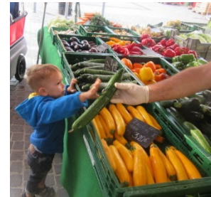
Abb. 14 Einkaufen auf dem Wochenmarkt, Jugendamt/Stadt Stuttgart

Seit 2012 haben wir, vermittelt über den Verein Future 4 Kids e.V., einen „Paten“, die Firma Pets Nature in Fellbach, die es uns finanziell ermöglicht, mindestens einmal in der Woche in jedem Altersbereich gemeinsam mit den Kindern ein gesundes Frühstück zu zubereiten. In der Regel gehen wir mit den Kindern am Tag vorher einkaufen, zum Bäcker um die Ecke, auf den Wochenmarkt direkt vor unserer Tür und/oder zum Supermarkt. Wir legen dabei in erster Linie Wert auf regionales, frisches Obst und Gemüse am liebsten in Bioqualität, Vollkornprodukte und Biomilchprodukte. Je nach Frühstücksangebot werden die Lebensmittel am Vortag bzw. am Frühstücksmorgen meist zusammen mit den Kindern zubereitet. Die Kinder lernen dabei die Lebensmittel, deren Zubereitung und den Umgang mit Küchenutensilien kennen.