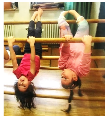
Abb. 5 Bewegungsraum, Jugendamt/Stadt Stuttgart

Im Kleinkindbereich bieten wir den Kindern vorrangig Spiel- und Bewegungsmaterialien an, die die Kinder in ihrer Entwicklung herausfordern. Diese ermöglichen den Kindern, in vertrauter Umgebung aktiv zu werden und ihrem Forscherdrang nachgehen zu können. Eine verlässliche Bindung zur Fachkraft und Geborgenheit dient den Kindern als Basis. Dadurch lernen sie wichtige Grundbewegungen, entwickeln ein gutes Körpergefühl und sind