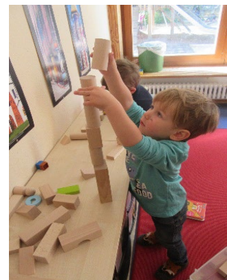
Abb. 6 Ein Turm entsteht

Im Altersbereich 3 bis 6 Jahre liegt der Schwerpunkt in der Förderung der Motorik, dem räumlichen Verständnis, der Architektur, der Sinneserfahrung und dem sozialen Miteinander. Dabei bieten wir ähnlich wie im Kleinkindbereich verschiedene Materialien, wie Magnete, Lego-, Holz- und Duplo-Bausteine, sowie Holzschienen, verschie-