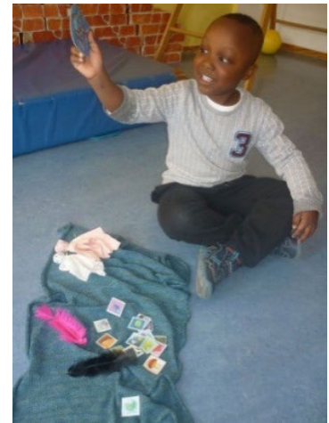
Abb. 4 Entwicklung einer Geschichte, Jugendamt/Stadt Stuttgart

Das Ziel des Märchenkoffers ist die Entwicklung des Sprachgefühls, Sprachverständnisses und Sprachbewusstseins, die Stärkung der Persönlichkeit und die Freude am kreative Umgang mit der Sprache. Zusätzlich entwickelt sich daraus unser individuelles Märchenbuch.