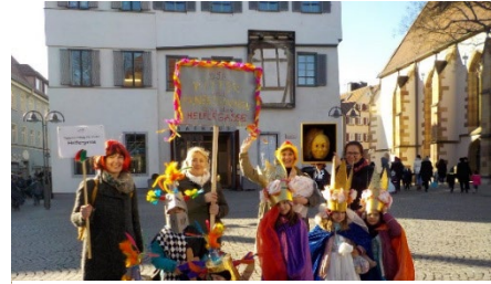
Abb. 3 Cannstatter Kinderfasching gemeinsam mit Eltern 2018, Jugendamt/Stadt Stuttgart

Es finden verschiedene Elternaktionen im gesamten Kitajahr statt: Ein Einführungselternabend, ein Themenelternabend, Beteiligung an Konzeptionstagen, Teilnahme an Jahreszeitenfesten und dem Sommerfest, Beteiligung und Mitgestaltung an Ausflügen und Veranstaltungen, Elterncafés und Elternfrühstücke, individuelle Elternberatung, einen Elterntreff mit verschiedenen Themen und das Frauentags-Cafe.