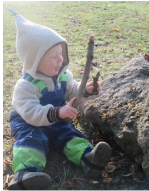
Abb. 8 Ausflug im Park

„In der Natur findet ein Kind Freiheit, Abenteuer und Ungestörtheit: eine Welt, fern von den Erwachsenen, einen eigenen Frieden.“ (Richard Louv, 2011, Das letzte Kind im Wald)