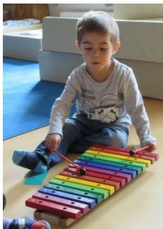
Abb. 11 Erste Erfahrungen mit Instrumenten, Jugendamt/Stadt Stuttgart

Eine Sache ist in allen Ländern der Welt sehr ähnlich, nämlich, dass Musik verbindet. Lieder und Tänze vermitteln ein Gefühl von Zusammengehörigkeit und geben dem Erlebten Emotionen. Musik ist bei uns in der Kita allgegenwärtig und begleitet uns