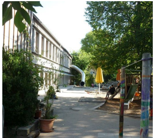
Abb. 1 Außenbereich, Jugendamt/Stadt Stuttgart

https://www.stuttgart.de/kita-helfergasse