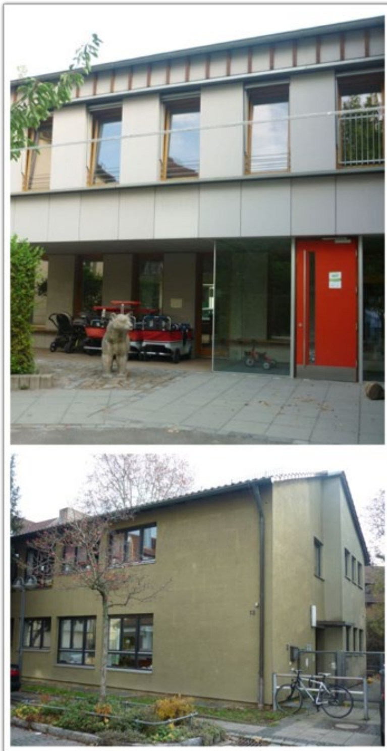
Kinder- und Familienzentrum Helfergasse 2, 10-12 70372 Stuttgart, Bad-Cannstatt