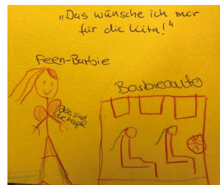
Abb. 2 Wunschzettel eines Kindes, Jugendamt/Stadt Stuttgart

Letztendlich wurden sich die Mädchen einig. Wir pädagogischen Fachkräfte standen den gekauften Barbie-Spielsachen sehr skeptisch gegenüber, aber die im Rahmen der Partizipation stattfindende Konsensfindung stand für uns letztlich im Vordergrund.