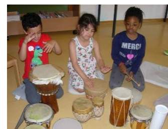
Abb. 12 Trommelangebot, Jugendamt/Stadt Stuttgart

Im Altersbereich 3 bis 6 haben wir mehrere musikalisch geschulte Mitarbeiter die die Kinder z.B. in der Morgenrunde mit der Gitarre oder dem Klavier begleiten. Die Kinder haben regelmäßig die Möglichkeit, begleitend durch die Fach-