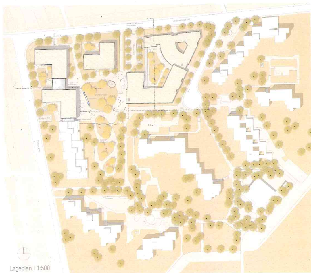
Abbildung 1: Siegerentwurf Wettbewerb von ARP, nicht maßstäblich.

Der Siegerentwurf sieht vor allem gegenüber dem jetzigen Gebäudebestand ein kleinteiligeres Bauensemble vor, dessen einzelne Baukörper sich um eine gemeinsame „Grüne Mitte“ gruppieren. Die hinzukommenden winkelförmigen Baukörper öffnen sich zur freien Landschaft hin. Der Entwurf beinhaltet eine kleinteiligere Gliederung der Ergänzungsbauten mit winkelförmigen Gebäuden. Die Ausformung des Freiraums erfolgt in Anlehnung an das seitherige Konzept von eher organisch geprägten, die Gebäude umfließenden Grünstrukturen.